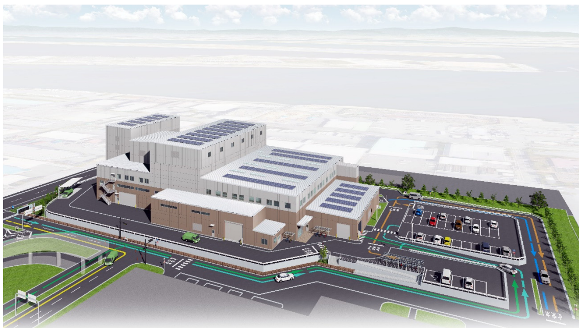
施設完成イメージ図

<広報お問合せ先> 極東開発工業株式会社 総務部 〒541-8519 大阪市中央区淡路町二丁目5番11号 電話 (06) 6205 - 7800 F A X (06) 6205 - 7830 ホームページアドレス https://www.kyokuto.com/