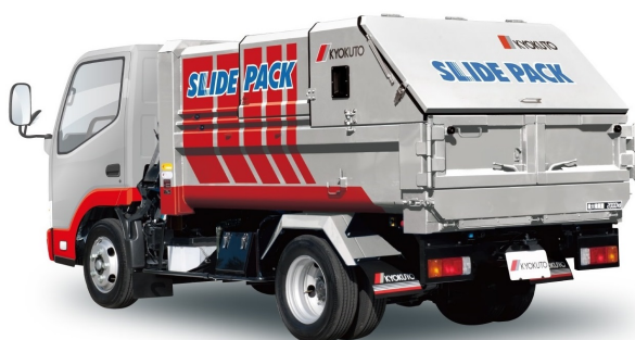
スライド天蓋閉 (走行状態)

また、金属製の天蓋を採用しているため、布製の幌などに比べ、高い耐久性を実現するとともに清掃しやすく、外観品質の維持に貢献します。