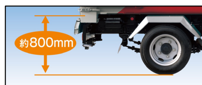
ボデーデッキ地上高