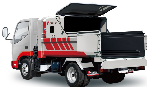
スライド天蓋開 (作業状態)