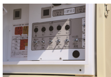
標準・高圧ワンタッチ切替スイッチ