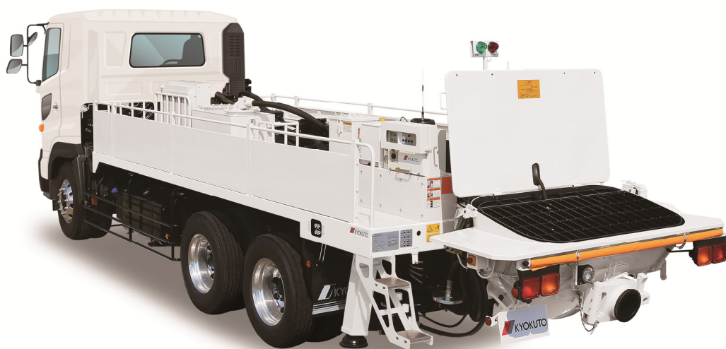
「ピストンクリート PT110-10」

極東開発グループでは、新機種の投入により製品ラインナップを拡充し、特装車事業の強化を図ってまいります。