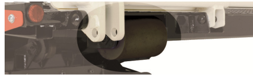
ボデー後端樹脂ローラ