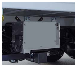
静音パワーユニット

従来から好評をいただいている業界トップクラスの静音パワーユニットや、より高い安心感を実感いただけるワイドスチフナ、アーム連結パイプの径を太くし剛性を高めたプラットホームを支えるタフネスアームなど充実の基本装備です。