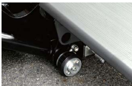
接地面樹脂ローラ

標準装備した接地面樹脂ローラにより、テールゲートと地面との接地衝撃音や摩擦音の低減を実現。