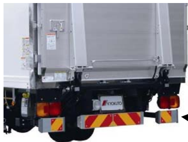
強化型リヤバンパー

2012年7月施行の突入防止装置規制に対応する強化型リヤバンパーを装備しています。