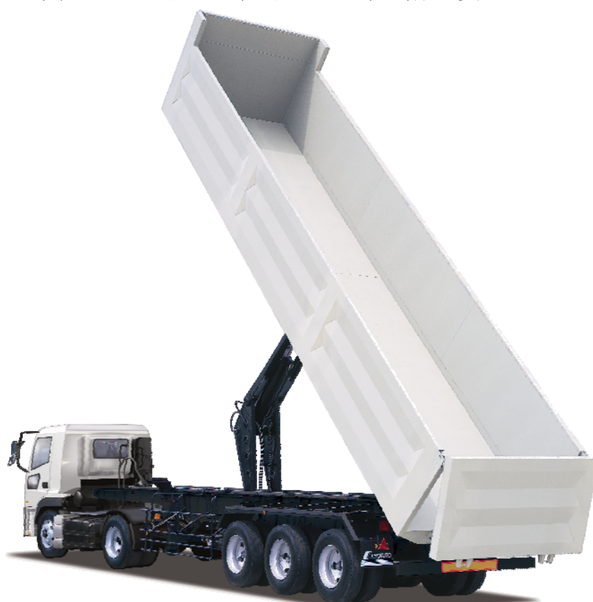
「深あおり長尺ダンプトレーラ」

極東開発グループでは、製品ラインナップの強化を図ることで、お客様の多様なニーズにお応えしてまいります。