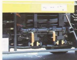
配管洗浄用ポンプ