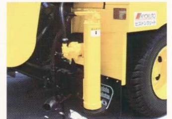
車体洗浄用水ポンプ