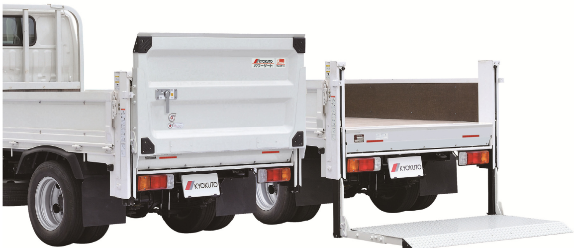
「パワーゲートV型プレスゲート（V600）」

極東開発グループでは、今後も製品ラインナップを拡充し、特装車事業の強化を図ってまいります。