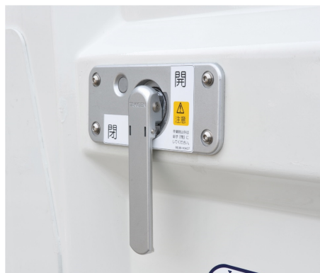
ワンタッチ式ゲートロック

開閉補助装置（トーションバー）を最適化し、より軽い操作力でのゲート開閉操作を可能としたほか、開閉力調整機構を搭載し、長期の使用により開閉操作が重くなっても開閉力を調整し軽さを維持することができます。従来から好評をいただいている標準設定のワンタッチ式ゲートロック（左右連動式ロック）と併せ、さらなる作業時間の短縮と、使いやすさの向上を実現します。