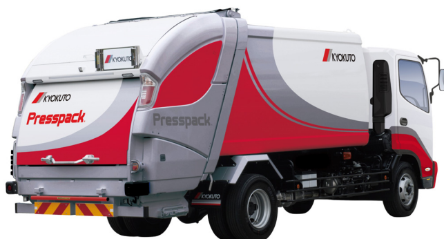
新型4トン車級プレス式ごみ収集車 「プレスパック」【参考出品】