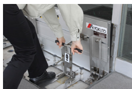
①ロック装置を手前に引いて ロックを解除する。