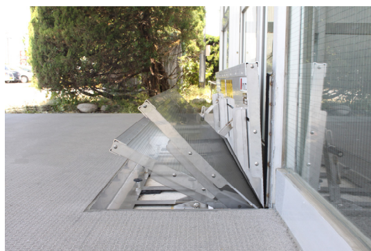
ショックレスダンパー

起立操作時の負担を軽減する補助スプリングや、収納操作時に防水板がゆっくり降下するショックレスダンパーなどを装備し、安全性と操作性を考慮した設計となっています。