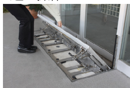
①防水板を持ち上げる。