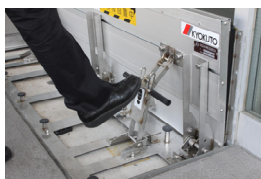
②ロック装置を踏んでロックする。